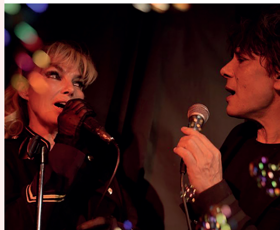
© Mario Hoffman et mariochka meyer