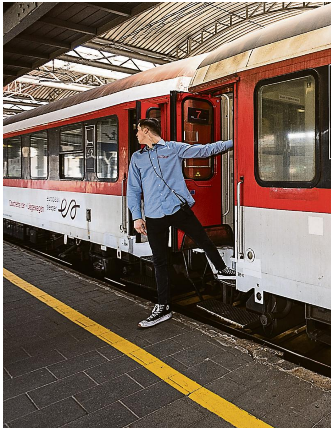
La jeune société propose un trajet total entre les deux capitales de près de 16 heures à l'aller, et 17 heures au retour contre un peu plus de 8 heures pour le TGV de jour.

Dou des temps de parcours dantesques comparé à l'avion, surtout avec les multiples travaux en cours sur le réseau allemand entre Hambourg et Berlin, qui contraignent à prendre des itinéraires bis. De plus,