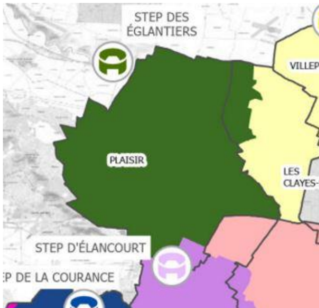
Les bassins de collecte