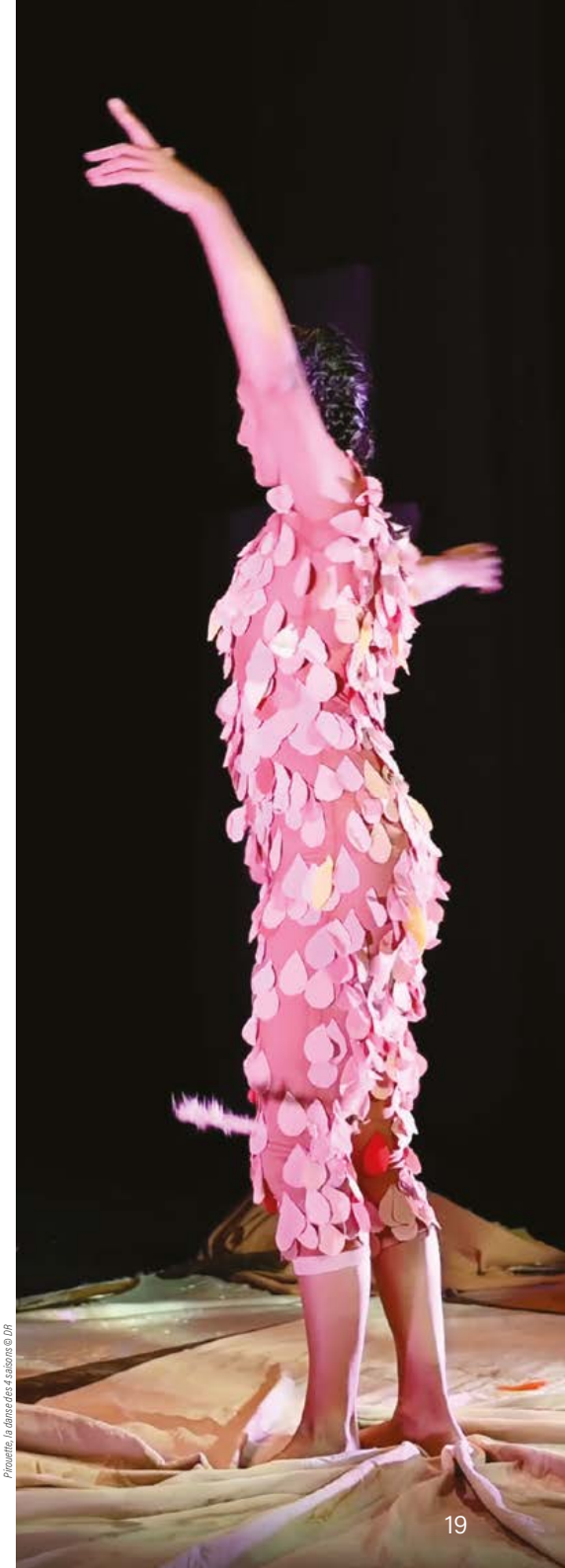
Pirouette, la danse des 4 saisons