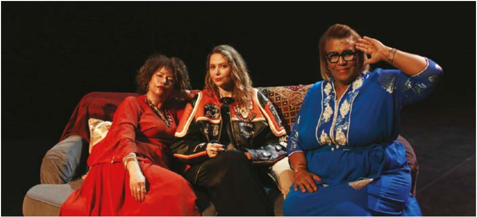
Les Héritières © Lila Benmansour