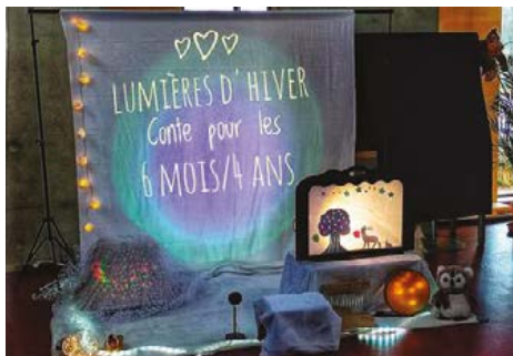
Lumières d'hiver, Charlotte Gilot © DR