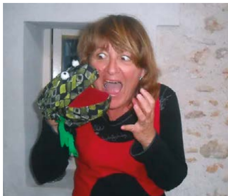
Michèle Walter