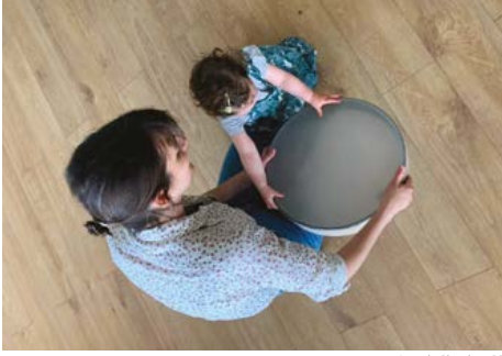
La vache Pistache