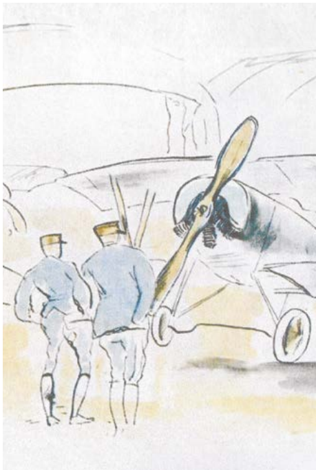
Histoire de l'aviation Guyancourt