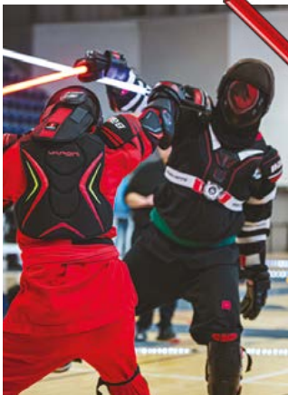
Académie de sabre laser de SQY

► Et toute la semaine : un quiz musical autour des musiques de films et séries et une Soirée Cult' autour d'Alien avec des scientifiques.