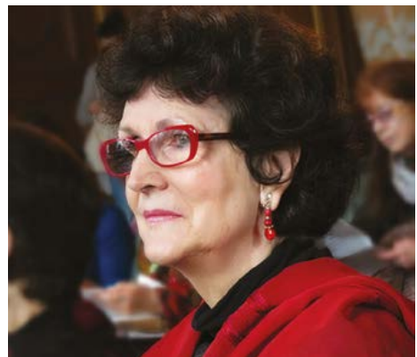
Cécile Oumhani © Monique Serot-Chaïbi

Gratuit, réservation conseillée : 01 30 44 39 39 / e-mediathèque.sqy.fr