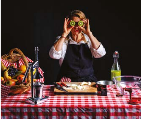
Va t'faire cuire un bœuf !