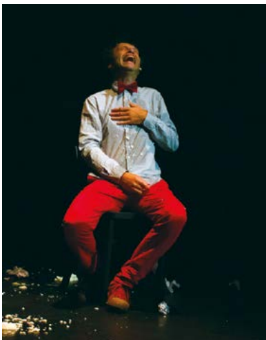
Yves Cusset