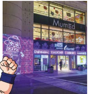
Nuit du jeu