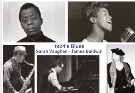
1924's Blues Sarah Vaughan - James Baldwin

Dès 19h, restauration sur place par Les Amis de l'Estaminet