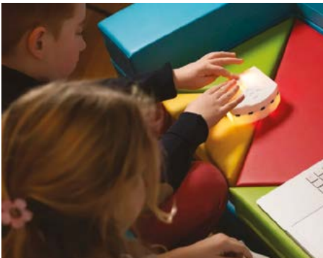
Robots Thymio