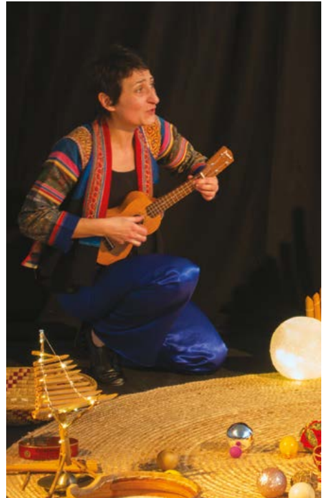
P'tit bonhomme de chemin