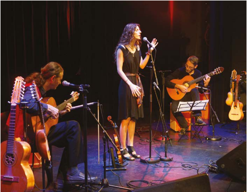
La caravelle, l'âme et le chevalet