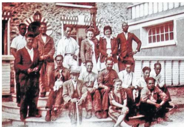
Les prisonniers africains qui ont trouvé refuge à l'auberge du Bouc étourdi.

Début juin 1944, des bombardements ont lieu dans le sud des Yvelines. Notamment accrus quelques jours avant le 6 juin, en vue du Débarquement sur les plages de Normandie. Des cashs d'avions se