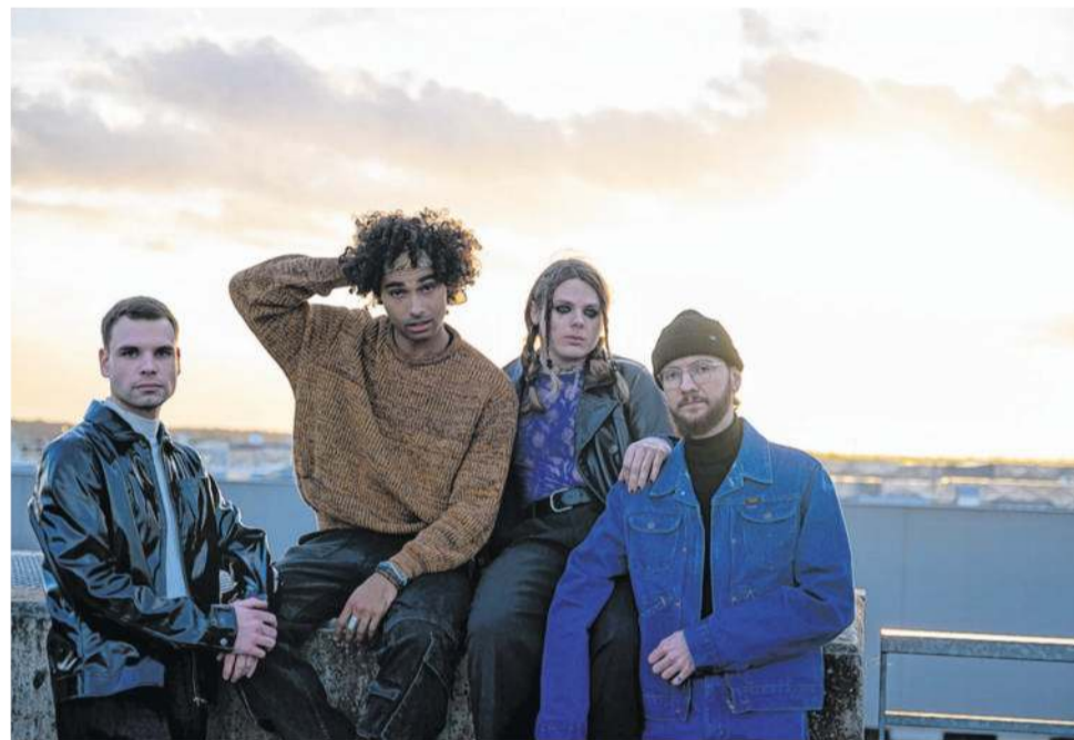
Le groupe rambolitain Entropie se produira à Rock en Seine. SigriedDuberos

Loan : On est ami depuis le collège, voire le primaire pour certains. Une partie des membres jouait en amateur, on s'est réuni et on a décidé de passer le cap. Depuis 3-4 ans,