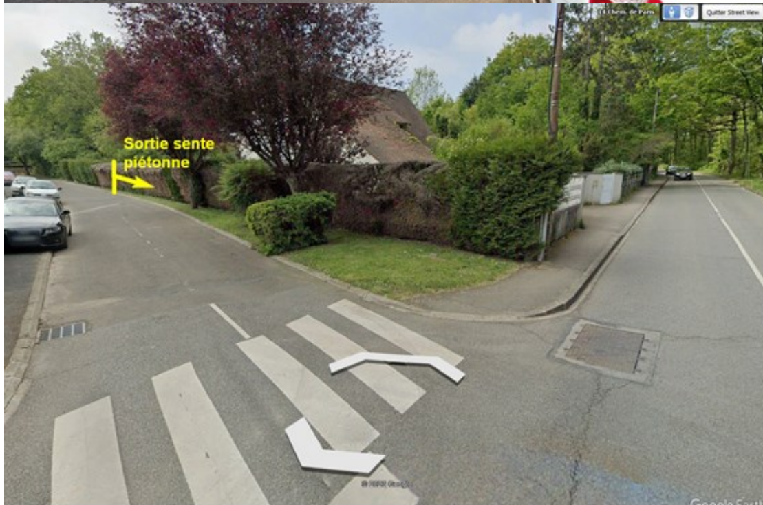
Maurepas d'hier et d'aujourd'hui