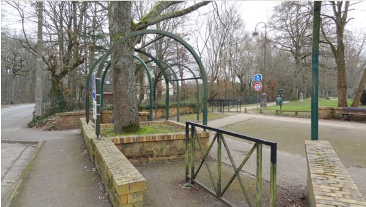
Maurepas d'hier et d'aujourd'hui