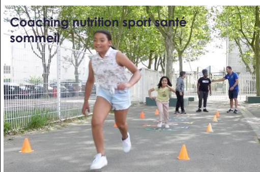
Coaching nutrition sport santé sommeil

15 séances de coaching réparties sur 2 mois sont animées par 3 coachs spécialisés.