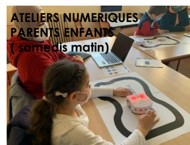
ATELIERS NUMERIQUES PARENTS ENFANTS (samedis matin)