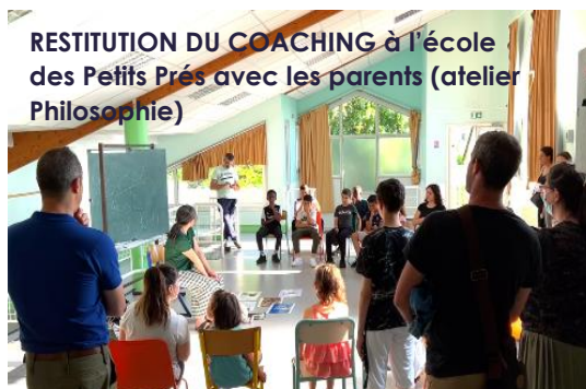
RESTITUTION DU COACHING à l'école des Petits Prés avec les parents (atelier Philosophie)

Le numérique y est abordé comme sujet relationnel et des outils sont au service du projet.